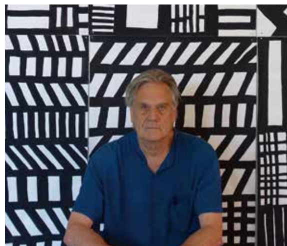
ジョージ・ソーデン氏

ジョージ・ソーデンは、1942年にイギリス・リーズに生まれ、学生時代に建築を専攻します。その後、建築家であり工業デザイナーのエットレ・ソットサスの事務所で経験を積み、オリベッティ社に入社し、コンピューターのデザインをはじめ、数多くの革新的なデザインソリューションを考案しました。1970年代には、ドローイングや実験的な作品を制作するだけでなく、デザインにおける装飾の刷新に関連した研究を開始し、1981年には、伝説的なメンフィス・グループの共同設立者として、デザイン界で注目を集めました。2010年に、自身のブランドである「ソーデン」を設立。合理的でありながらもユニークなデザインの数々で、デザイン界に新風を巻き起こしています。