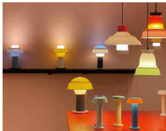
2021年のミラノサローネでの展示の様子

そこから生まれるプロダクトの数々は、ユニークでありながらも合理的。部品のモジュール化によって、様々な構成が可能なライティングコレクションを発表するなど、これまでにない革新的なデザインで注目を集めています。