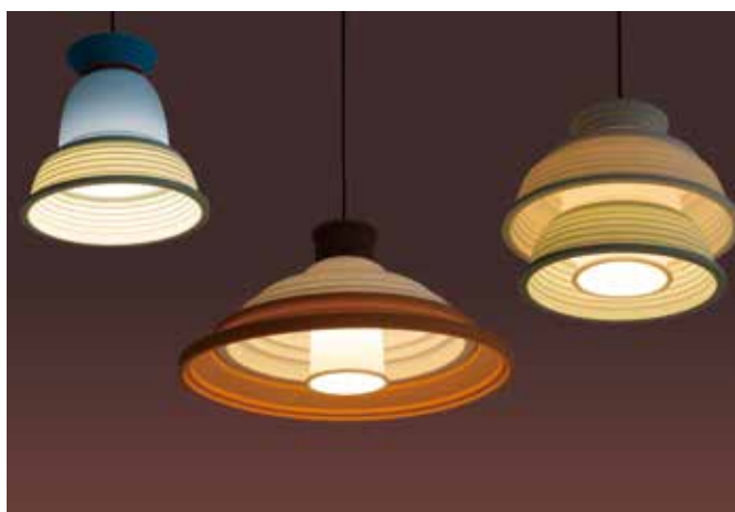
シーリングランプ(点灯時)

■ お問い合わせ 株式会社インターオフィス www.interoffice.co.jp