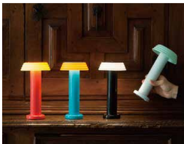
USB-Cにて充電できるポータブルランプ

【ランプシェード】シリコン 【ソケット】E26 【電球】LED 7W (電球付) 【ケーブル長さ】2m 引掛シーリング (フランジカバー付)